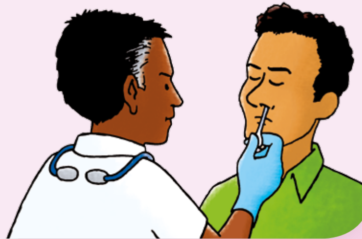
handschoenen, schort, masker, muts